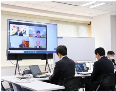
審査はweb形式で行われました

国の「国土強靱化」の取り組みの一環として、(一社)レジリエンスジャパン推進協議会が、事業継続に関する取り組みを積極的に進めている事業者を「国土強靱化貢献団体」として認証する制度です。