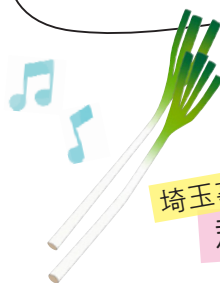
埼玉事業部 郡司 眉佳